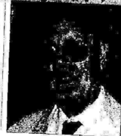
الدكتور مصطفى الشكعة